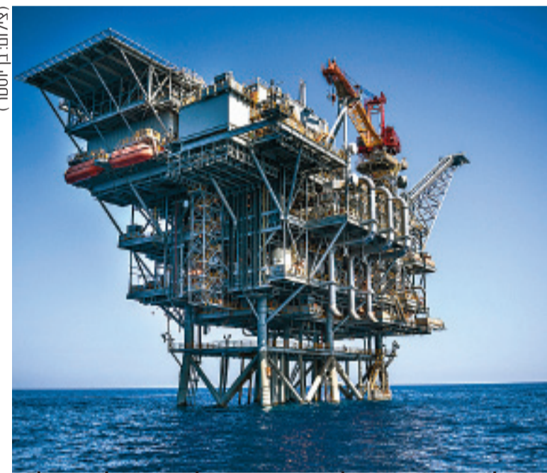
תמר. לנגוצקי ושטיינמץ (למטה) התדיינו אצל "בורר האלפיון העליון"

עו"ד שגב, שייצג בהליכי בוררות רבים, מדגיש כי היות שקשה מאוד לערער על פסקי-בורר, הריב החשוב ביותר בהליכים הללו הוא הוות הבורר. שגב: "הואיל ולא ניתן לערער, בהליכי בוררות וכולי על הידיים והראש של הבורר ונתת את גורלך בידי". לכן, כשקליינט שלי רוצה שנכניס סעיף בוררות בחוזה, אני רואה לכך שיהיה כתוב שהבורר, לפי הצורך, יהיה שופט בדימוס של בימ"ש מחוזי או של בימ"ש עליון. ואם אין הסכמה לכך, אני לא מסכים להתניית בוררות בהסכם". כדי להמחיש עד כמה הוות הבורר מכריעה, מוכר שגב שהוא ייצג בעבר בבוררות שנערכו בפני נשיא ביהמ"ש העליון לשעבר, מאיר שמגר. "במקרים הללו קיבלתי בורר בעל יושר קיצוני שעובד לפי חוק, מנמק את פסקי הבוררות לעילא ונתון פסק-בוררות תוך זמן קצר. זה שירות בוררות דה-לוקס, ששווה כל אגורה". יצוין, כי שמגר גובה שכר-טרה דומה לזה שגובה אוקון - כ-2,500 שקל לשעה.