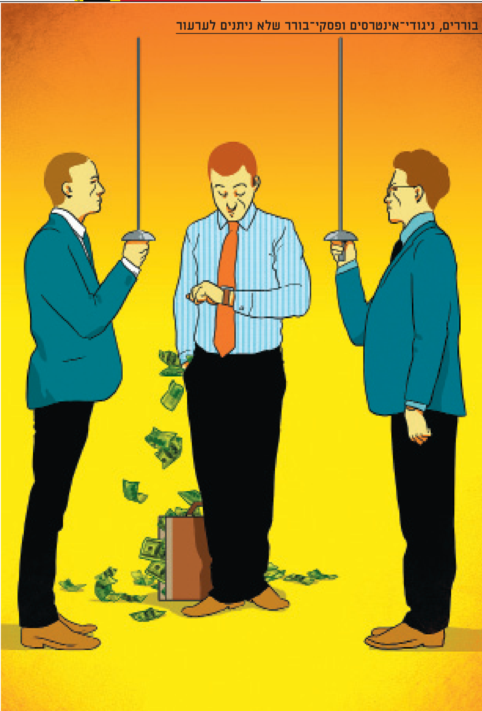
אילור: שחור הפחית

שגב: "הופעת לא פעם בפני בוררים שכל מה שעניין אותם היה למשוך את הזמן על עוד ישיבה ועוד ישיבה, כדי להרוויח יותר, וכל מה שעניין אותם זה הם עצמם. הם לא למדו את החומר. זאת הייתה בוסה וחרפה, ואתה גם לא יכול לבטל את השגיאות המהותיות שלהם"